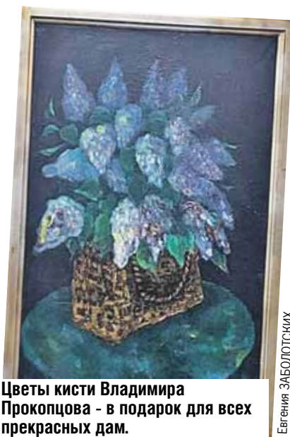
Цветы кисти Владимира Прокопцова - в подарок для всех прекрасных дам.

Прима Большого театра России Оксана Волкова стала режиссером праздничного выступления белорусов.