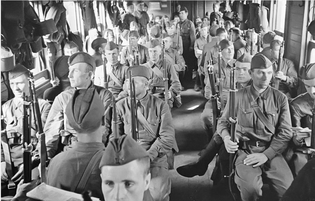
Москва. 1941 г. На фронт на электричке