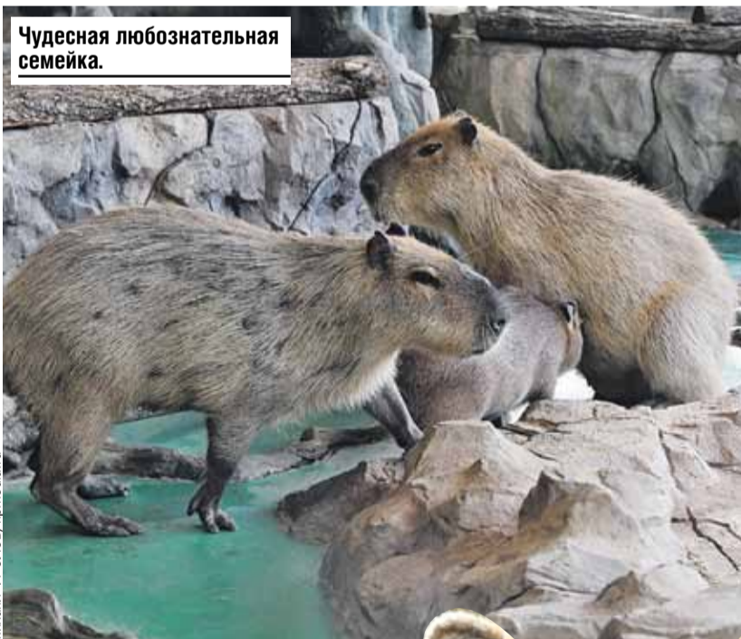
Чудесная любознательная семейка.

Зимой капибары, будучи обитателями Южной Америки, переселяются в теплый вольер. Раньше они жили в маленьком домике, а теперь у них есть просторное помещение, где можно бегать и купаться.