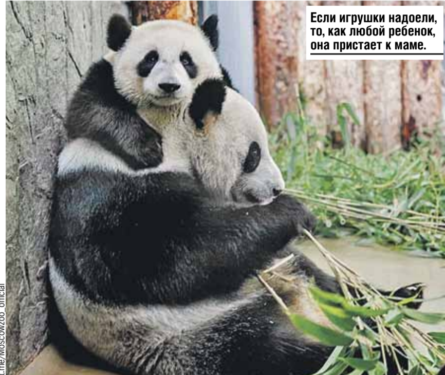
Если игрушки надоели, то, как любой ребенок, она пристает к маме.

Весной и летом Тимофей сбрасывает лишний вес, а к зиме зажиривается, как говорят сотрудники зоопарка. Но всегда остается суровым и очаровательным.