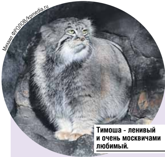
Тимоша - ленивый и очень москвичами любимый.

Царству животных в столице России 160 лет. И его просто необходимо посетить.