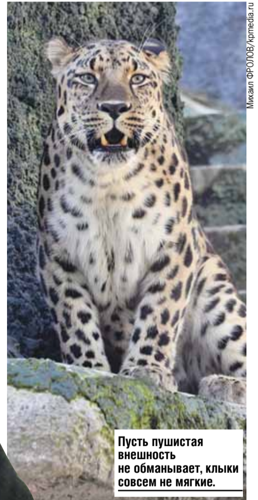
Пусть пушистая внешность не обманывает, клыки совсем не мягкие.

Будь в зоопарке лишь одна Катюша - уже стоит прийти и посмотреть.