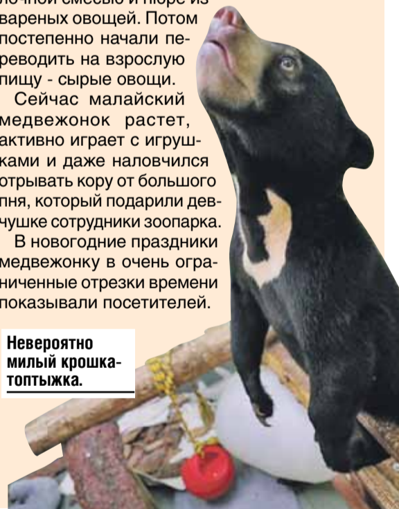
Невероятно милый крошкотоптыжка.

В новогодние праздники медвежонку в очень ограниченные отрезки времени показывали посетителей.