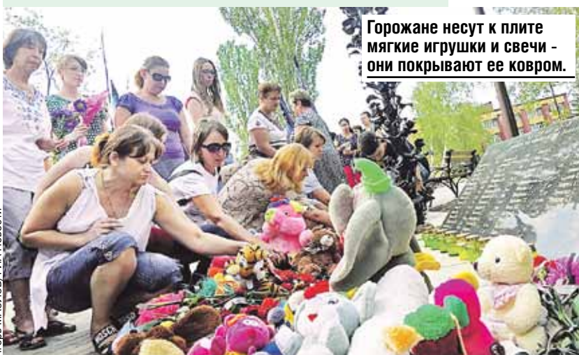
Горожане несут к плите мягкие игрушки и свечи - они покрывают ее ковром.

Традиционно у мемориала проходят мероприятия, посвященные Дню Победы.