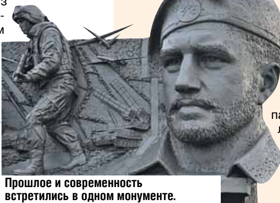
Прошлое и современность встретились в одном монументе.

Мемориал представляет собой два шурфа и опрокинутую вагонетку. Над одним из них - развевающееся каменное знамя. Рядом табличка с надписью: «Здесь покоится прах зверски замученных и сброшенных в шурф шахты мирных жителей, участников донецкого подполья, военнопленных солдат и офицеров. Вечная им слава, вечная память, вечный покой...»