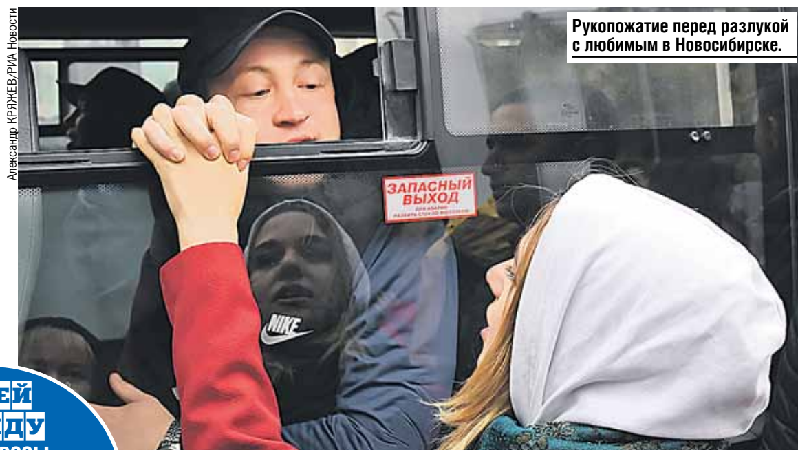
Рукопожатие перед разлукой с любимым в Новосибирске.

ИМЕЙ В ВИДУ ВСЕ ВОПРОСЫ ПО МОБИЛИЗАЦИИ МОЖНО УТОЧНИТЬ ПО МОБИЛЬНОМУ НОМЕРУ 112, А ТАКЖЕ НА САЙТЕ ОБЪЯСНЯЕМ.РФ.