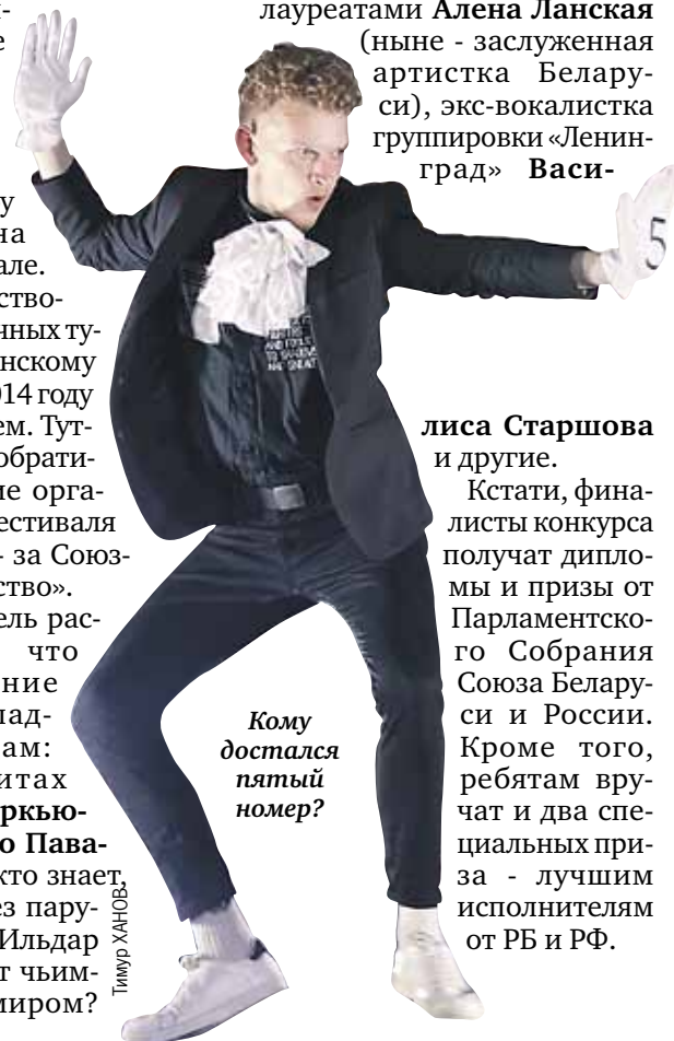
Кому достался пятый номер?

Кстати, финалисты конкурса получают дипломы и призы от Парламентского Собрания Союза Беларуси и России. Кроме того, ребятам вручат и два специальных приза - лучшим исполнителям от РБ и РФ.