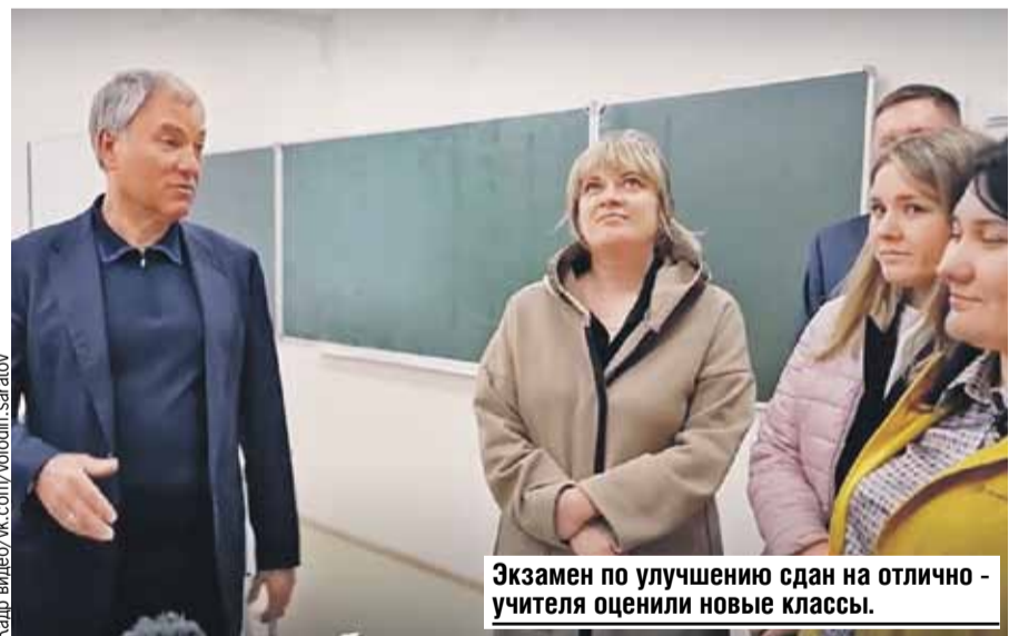
Экзамен по улучшению сдан на отлично - учителя оценили новые классы.

На момент подписания номера проголосовало 177,5 тысячи человек.