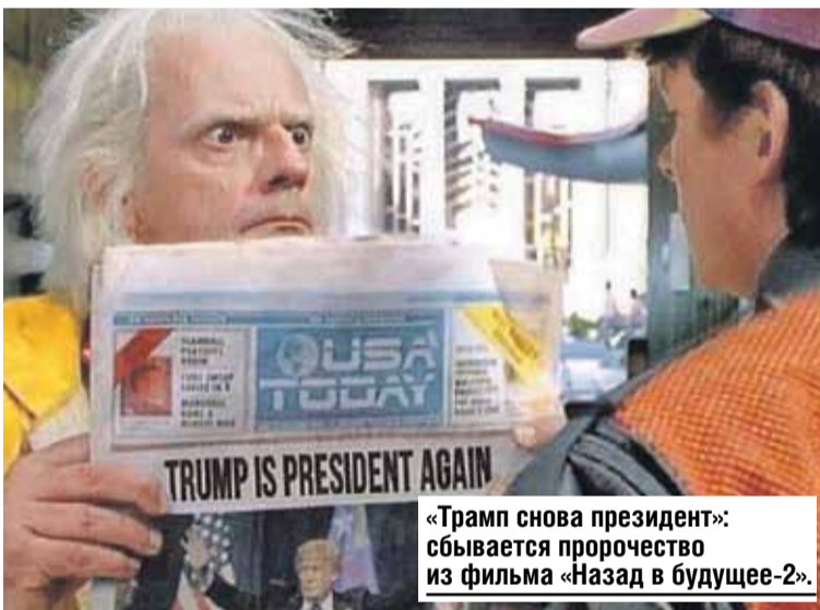
«Трамп снова президент»: сбывается пророчество из фильма «Назад в будущее-2».

разом, обе палаты Конгресса будут теперь с республиканским большинством - стали властью законодательной и исполнительной. «Синие» демократы больше не смогут пропихнуть свои законы.