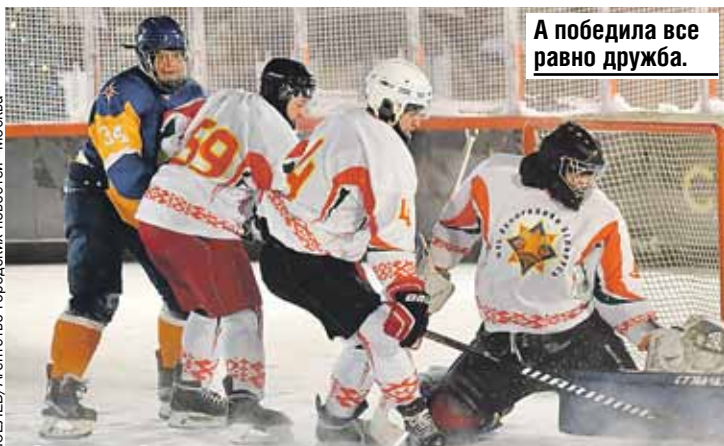
А победила все равно дружба.

образовался стихийный лагерь из нескольких тысяч беженцев, которые приехали из Африки и Ближнего Востока. Польские силовики, не давая им проникнуть на свою территорию, использовали слезоточивый газ, водометы и оружие. Позже белорусские власти разместили мигрантов в транспортно-логистическом центре в Брузгах недалеко от границы с Польшей. Несколько тысяч человек уже вернулись на родину.