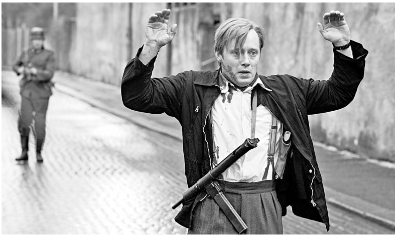
Кадр из фильма «Макс Манус»

Название фестиваля не случайно: классика – это истоки и традиции, а авангард – прорыв в будущее. Не случаен и город – еще Петр Великий назвал Оренбург «ключом к Азии», потому что находится он на стыке географических понятий Европы и Азии. В Оренбургской области проживают представители 119 народностей. Фестиваль организован кинокомпанией «Росфильм», Минкультуры РФ и администрацией Оренбургской области.