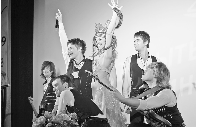
На закрытии фестиваля «Улыбнись, Россия!»

Международный кинофестиваль «ВОСТОК & ЗАПАД. КЛАССИКА И АВАНГАРД» с этого года позиционирует себя как фестиваль Co-production.