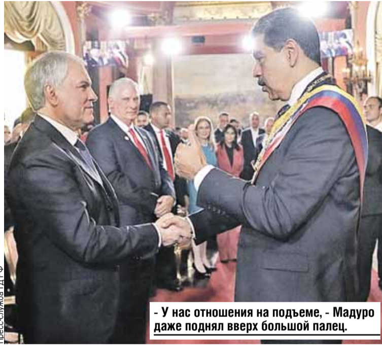
- У нас отношения на подъеме, - Мадуро даже поднял вверх большой палец.

давно - на октябрьском саммите БРИКС в Казани.