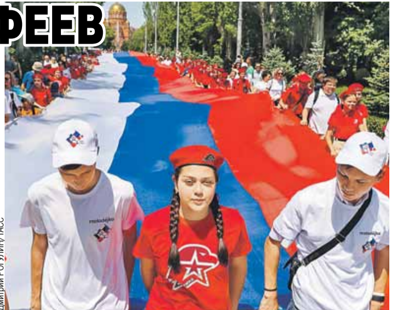
Участники акции «Бессмертный полк. Наши Герои» пронесли по Волгограду гигантский триколор.

Цветами российского триколора горел небоскреб Дубая Бурдж-Халифа, в Тель-Авиве угощались на улице русской кухни, и даже в Брюсселе Писающего мальчика одели в костюм русского гренадера. Праздник отмечали по всей планете.