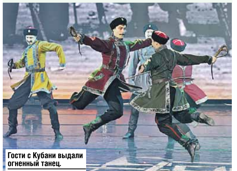
Гости с Кубани выдали огненный танец.

- Когда мы выступаем в столице нашего братского народа, нас всегда встречают очень тепло. Громкие аплодисменты долго звучали и в честь участников детского ансамбля «Аллегро» из ЛНР.