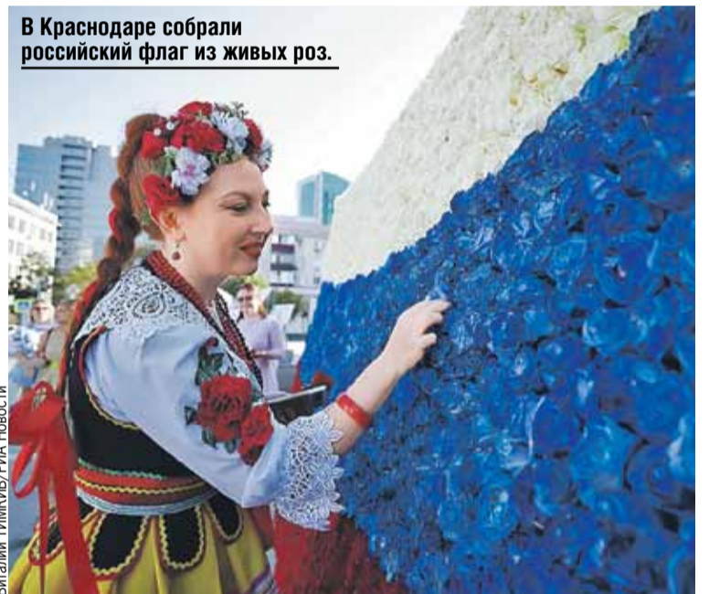
В Краснодаре собрали российский флаг из живых роз.