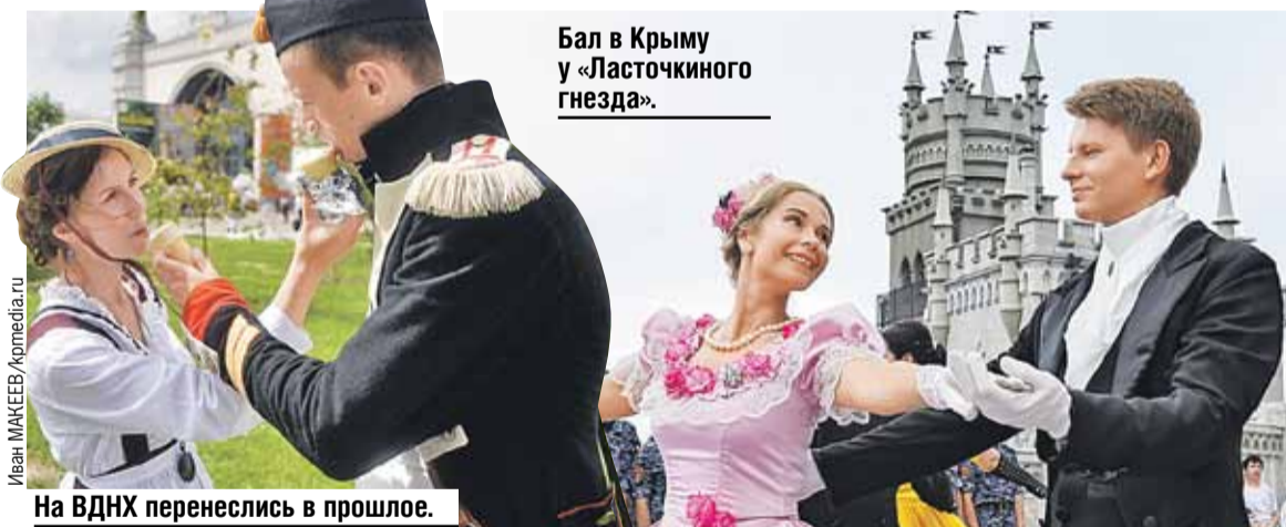
Бал в Крыму у «Ласточкиного гнезда».