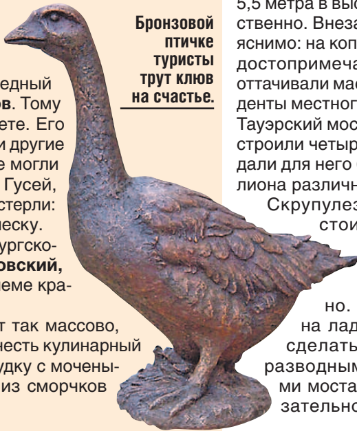
Бронзовой птичке туристы трут клюв на счастье.

Сейчас арзамасский символ не разводят так массово, но в начале лета проходит названный в его честь кулинарный фестиваль. Там можно оценить гусиную грудку с мочеными яблоками, гуся на сене с мороженым из сморчков и прочие изыски.