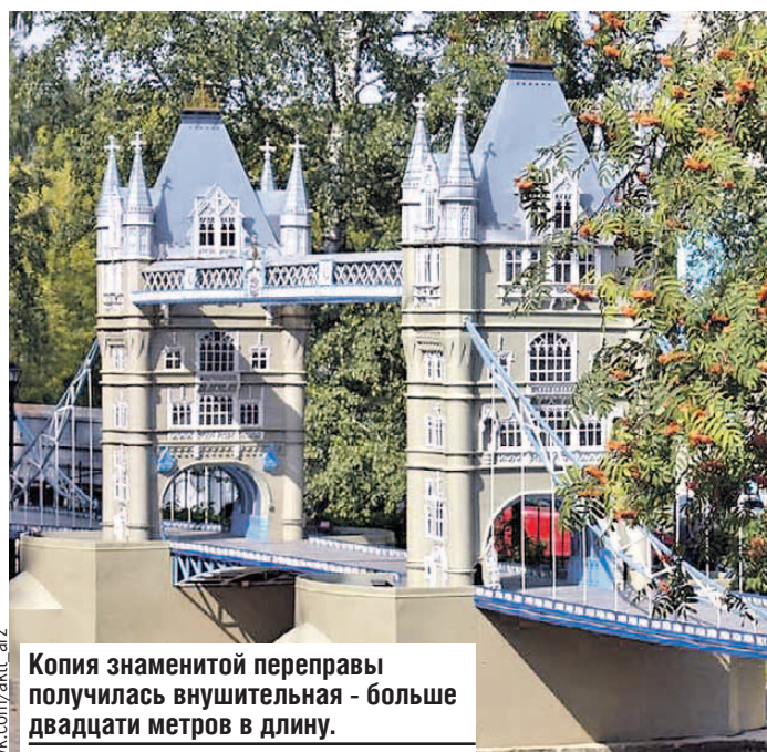
Копия знаменитой переправы получилась внушительная - больше двадцати метров в длину.

особый интерес - очень уж атмосферные фото получаются с таким «реквизитом». А ночью эти достопримечательности эффектно подсвечиваются. Совсем как оригиналы!