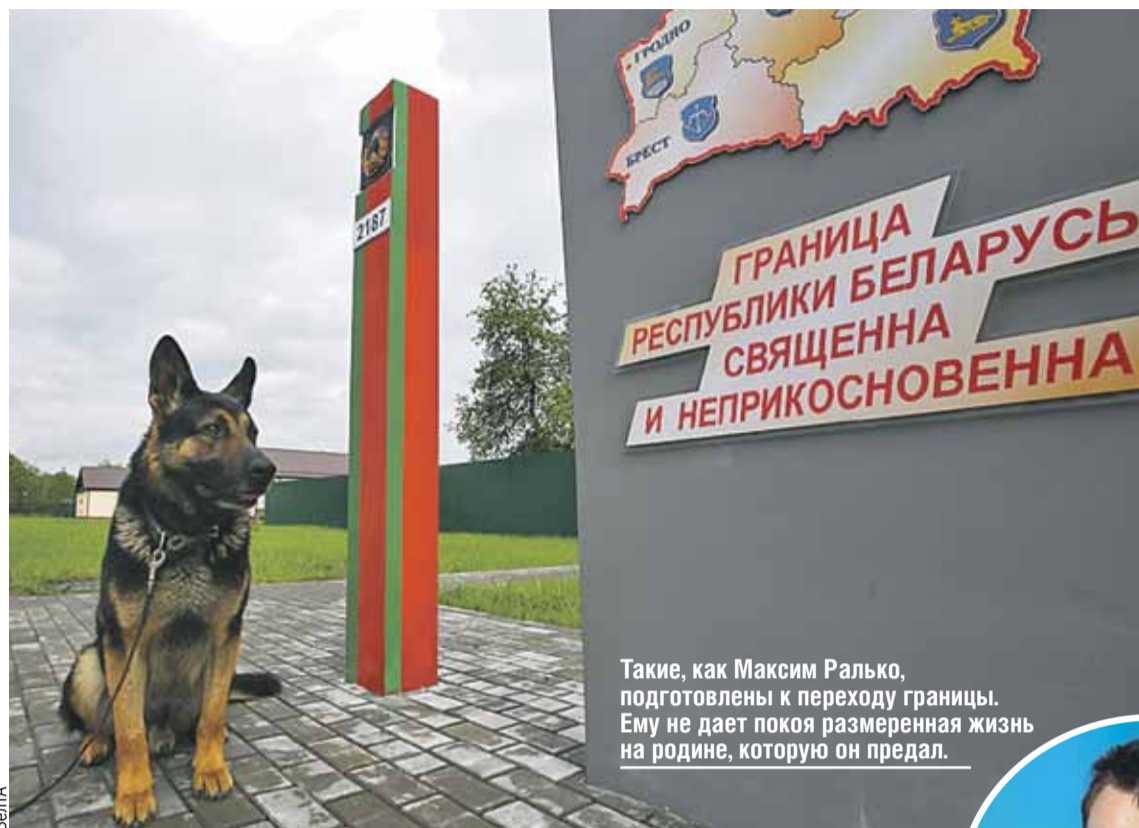
Такие, как Максим Ралько, подготовлены к переходу границы. Ему не дает покоя размеренная жизнь на родине, которую он предал.