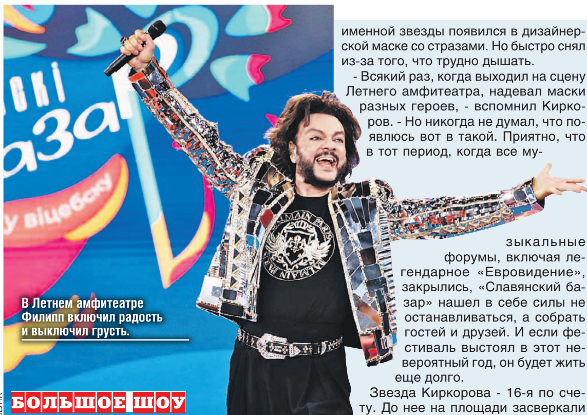
В Летнем амфитеатре Филипп включил радость и выключил грусть.

В ответственный момент погода не подвела, хотя в полночь на столбике термометра было не больше восьми градусов. Но зрители никак не хотели расставаться с артистами даже после финальных аккордов и не раз вызывали их на бис.