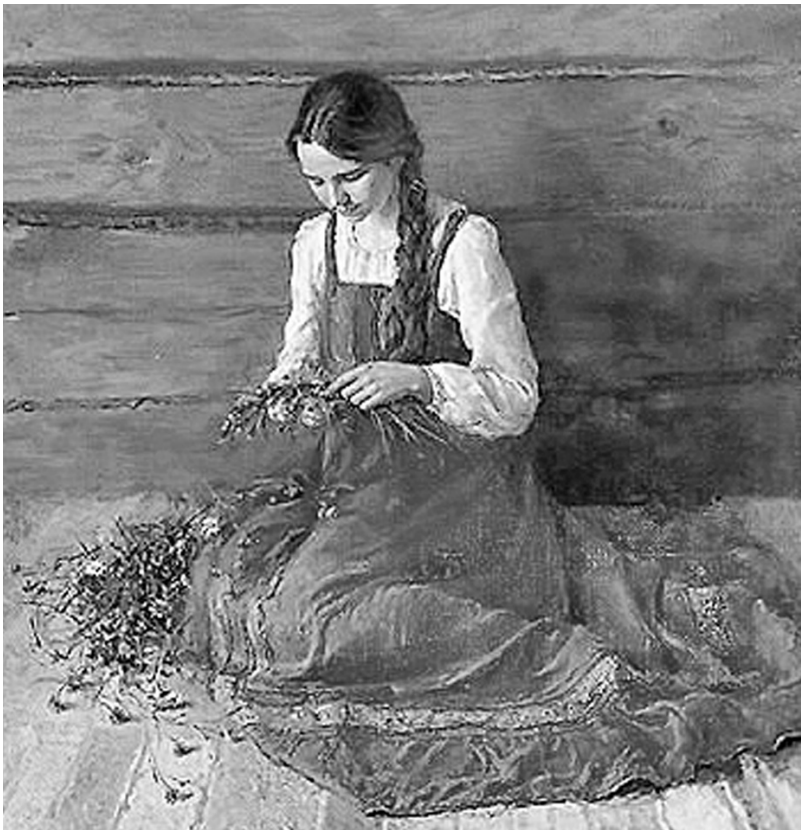
Девушка в голубом сарафане