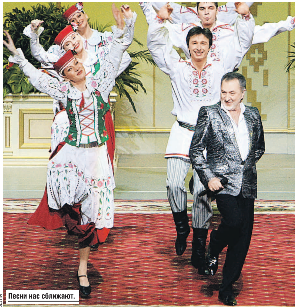
Песни нас сближают.

одной и той же истории. Посмотрите сами, даже за такой небольшой промежуток времени, который прошел с момента распада Союза, успели перетасовать огромное количество исторических фактов! Оказалось, что так легко все перевернуть в угоду кому-то. Поэтому я прошу: давайте говорить друг другу правду, давайте