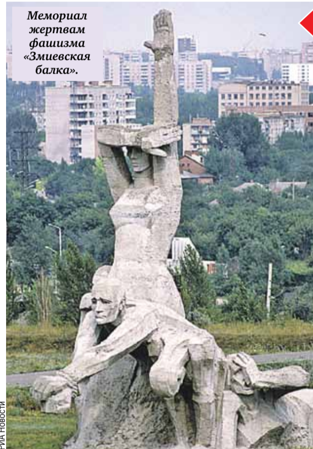
Мемориал жертвам фашизма «Змиевская балка».

Памятник детям - жертвам войны в Красном береге никто не оставляет равнодушным.