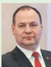
Роман Головченко, Премьер-министр