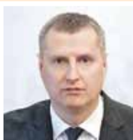
Дмитрий Крутой, Глава Администрации Президента Беларуси