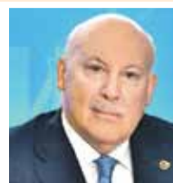
Дмитрий Мезенцев, Государственный секретарь