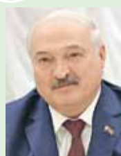
Александр Лукашенко, Президент

Заслушивает отчет Председателя Совета Министров о том, как выполняются принятые решения.