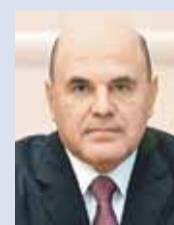
Михаил Мишустин, Председатель Правительства