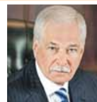
Борис Грызлов, Чрезвычайный и Полномочный Посол РФ в Беларуси