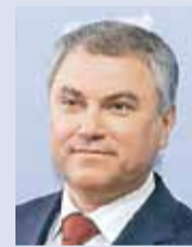
Вячеслав Володин, Председатель Государственной Думы