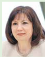
Наталья Кочанова, Председатель Совета Республики