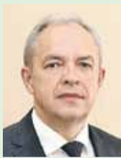
Игорь Сергеенко, Председатель Палаты представителей Национального собрания