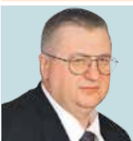
Алексей Оверчук, Заместитель Председателя Правительства РФ

Обсуждает актуальные вопросы российско-белорусского сотрудничества и союзного строительства. Рассматривает проекты повесток заседаний Совета Министров и Высшего Государственного Совета и ход подготовки согласованных документов. Выполняет иные поручения СМ.