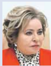
Валентина Матвиенко, Председатель Совета Федерации