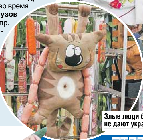
Злые люди бедной киске не дадут украсть сосиски!