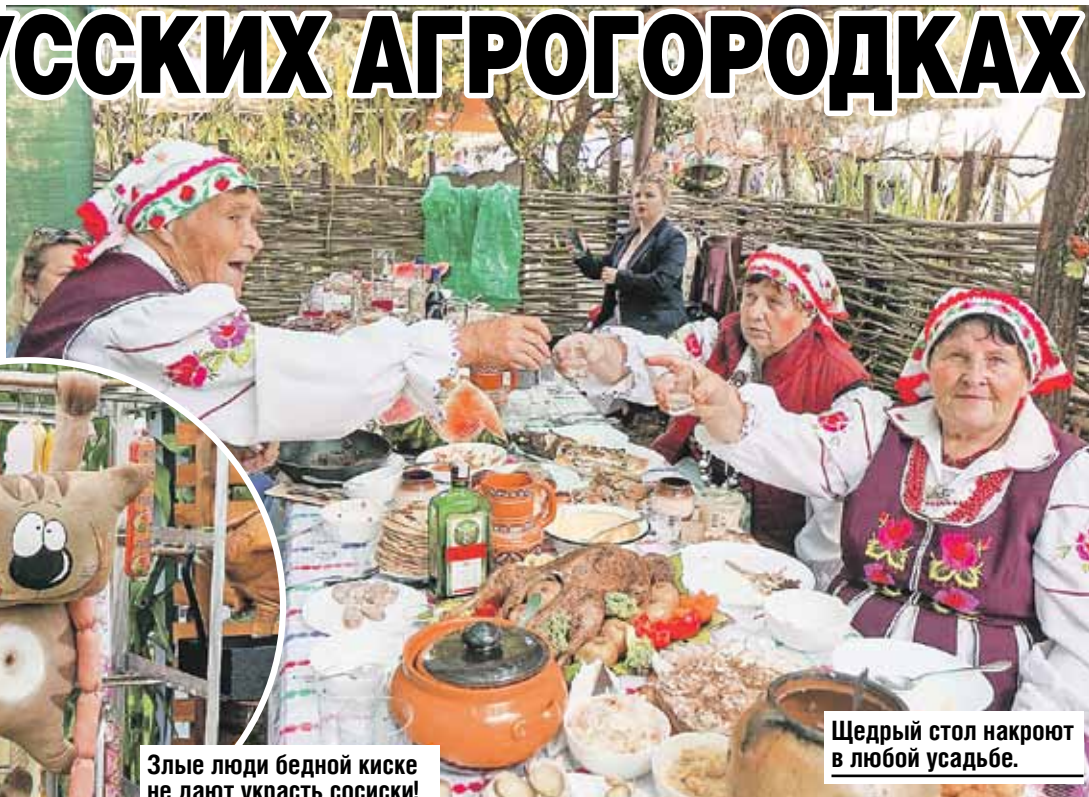
Щедрый стол накроют в любой усадьбе.

Впрочем, не фестивалем единым живет агрогородок. Тут работает успешный сельскохозяйственный комплекс «Александровское». Поэтому в качестве сувенира с собой всегда можно увезти окорок или форель.