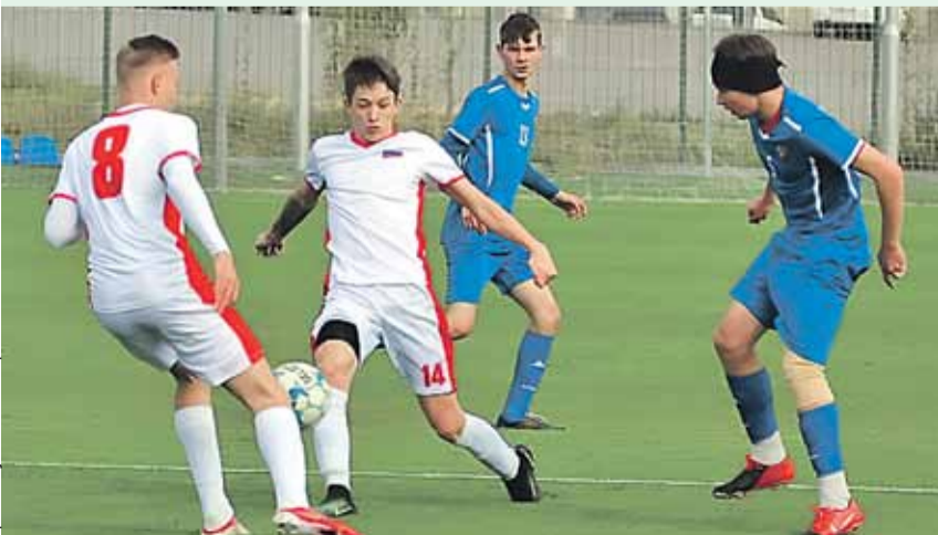
Никто не хотел уступать. Каждый матч проходил в бескомпромиссной борьбе.

Основная задача, которую ставят перед собой организаторы Спартакиады - Постоянный Комитет Союзного государства и Министерства спорта РФ и РБ, - не только спортивные результаты, хотя и они важны для участников. Главное - упрочить связи между народами двух наших стран, сделать так, чтобы молодежь лучше понимала друг друга. Ведь это залог крепкой дружбы наших стран и в будущем.