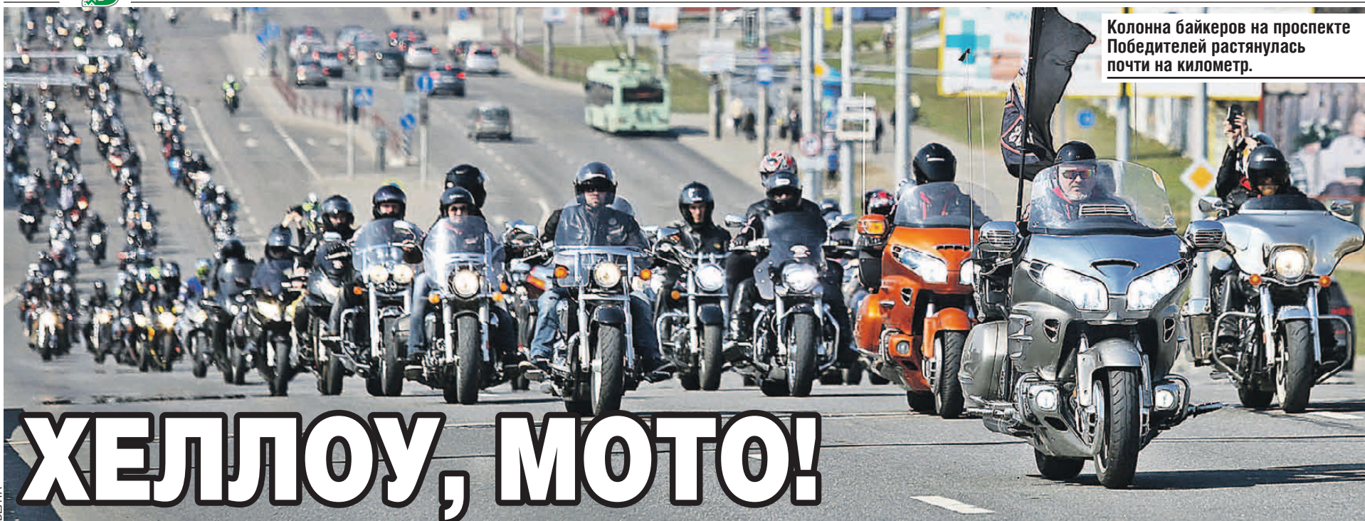
Колонна байкеров на проспекте Победителей растянулась почти на километр.