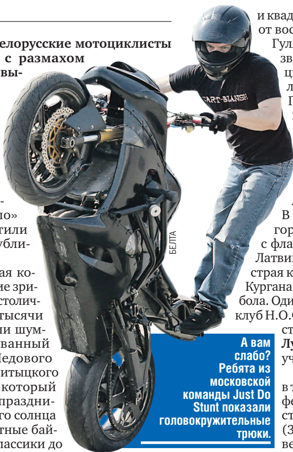
А вам слабо? Ребята из московской команды Just Do Stunt показали головокружительные трюки.

Гвоздь развлекательной программы - представление московской команды стантрайдеров Just Do Stunt. Ребята «жгли напалмом» - выделывали такие трюки на мотоциклах