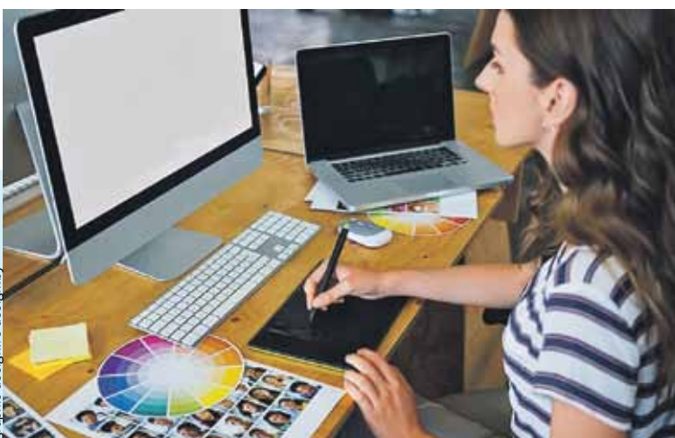
От простого рисунка до дизайна мобильного приложения рукой подать.

Самый высокий конкурс при поступлении в белорусские университеты уже лет десять на специальностях, связанных с дизайном. Как увеличить шансы на успех при поступлении? Постигать эстетику линий, форм и цвета с младых ногтей можно в минской Академии визуальных коммуникаций Re:DESIGN. Занятия подойдут даже самым юным слушателям: второклассников тут готовы обучать не только изобразительному искусству, но и цифровому рисунку, бумажной пластике, современному комиксу и скульптурной