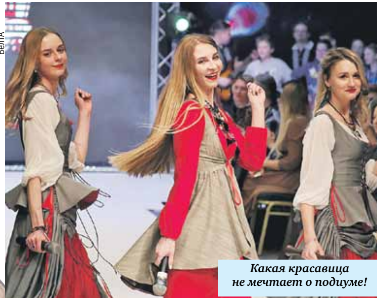
Какая красавица не мечтает о подиуме!