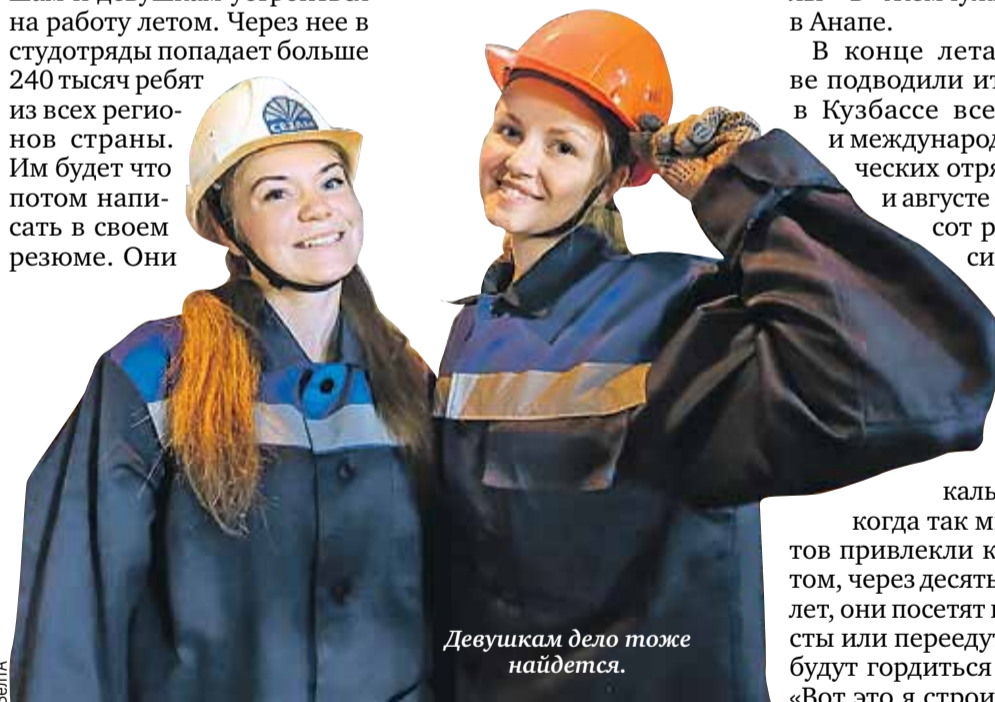
Девушкам дело тоже найдется.