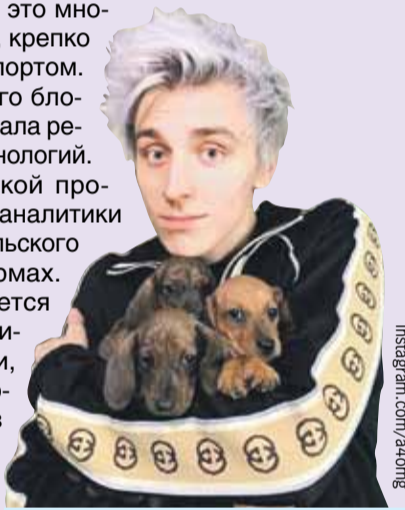
Влад - белый и с пушистыми.