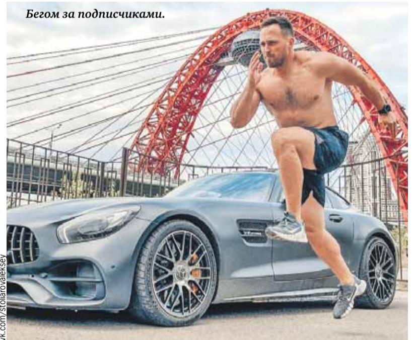
Бегом за подписчиками.