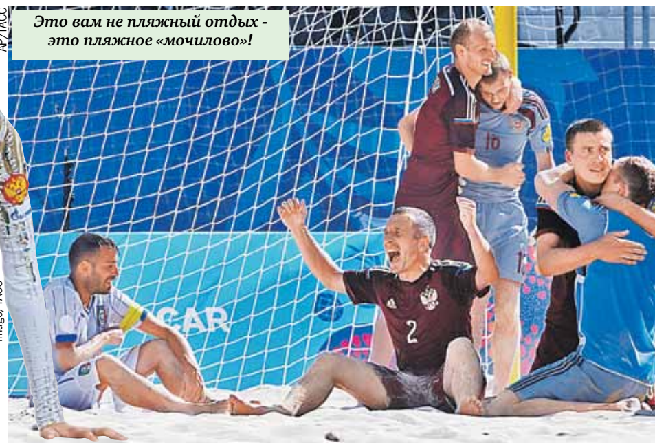
Это вам не пляжный отдых - это пляжное «мочилово»!