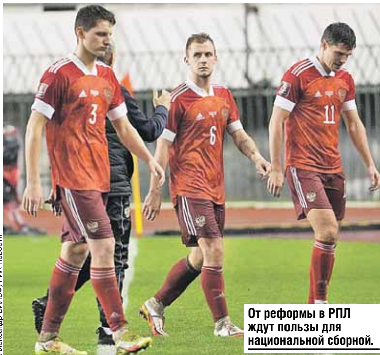
От реформы в РПЛ ждут пользы для национальной сборной.