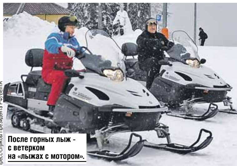
После горных лыж - с ветерком на «лыжах с мотором».

работающим раз в год, они не выгуляли за весь срок своего президентства.