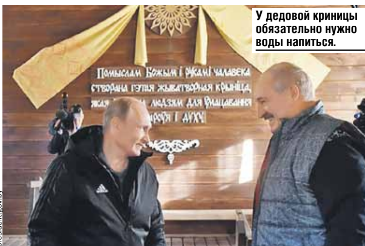
У дедовой кривницы обязательно нужно воды напиться.

- Я благодарен за приглашение, что удастся в это бурное время хотя бы немного побы-