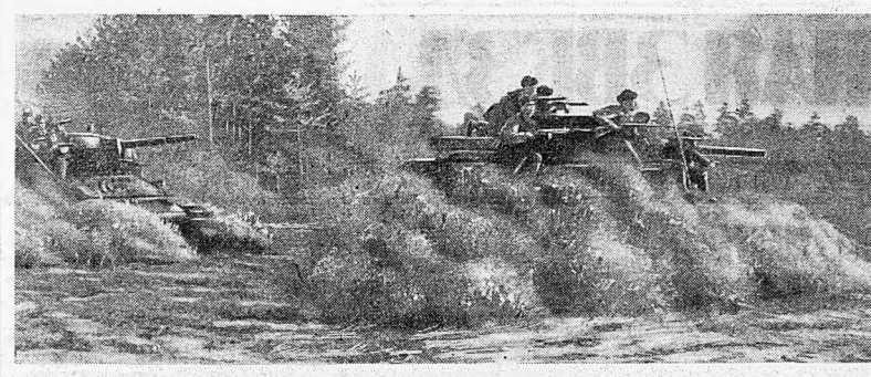
ДЕЙСТВУЮЩАЯ АРМИЯ. Танковый десант атакует противника.