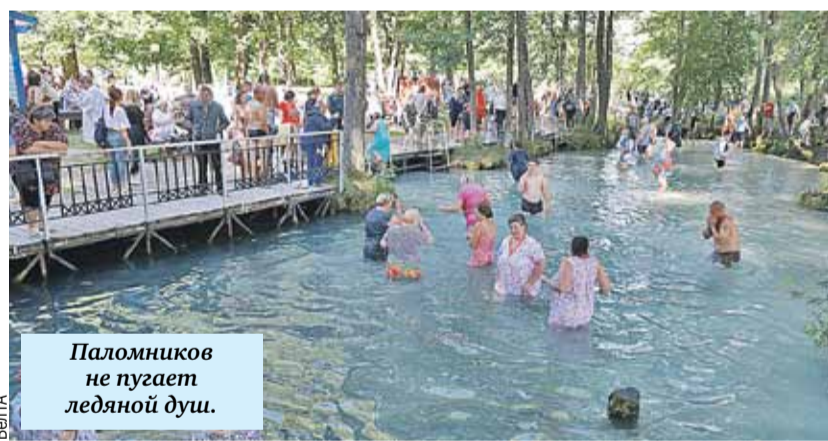
Паломников не пугает ледяная душ.

❖ ГДЕ: село Пощупово, Рязанская область.