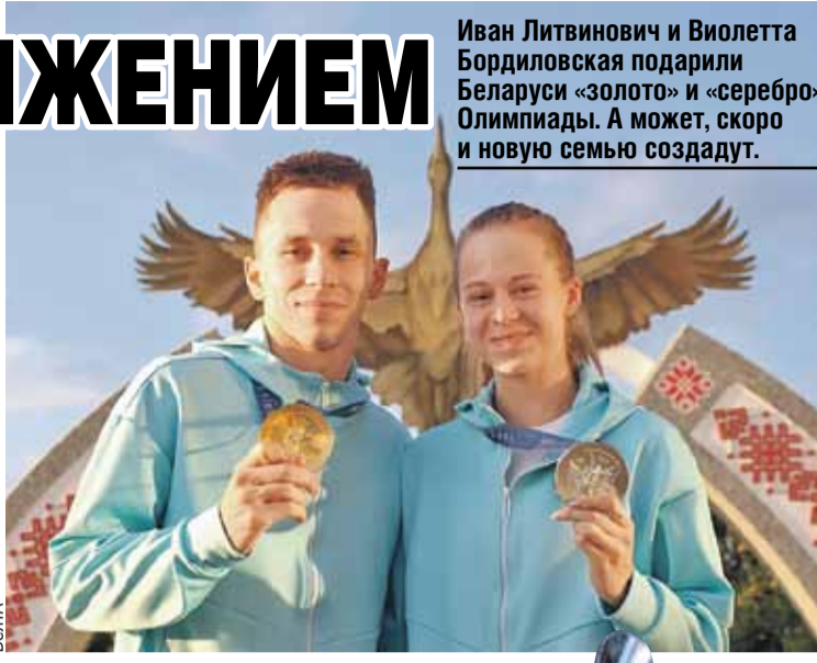
Иван Литвинович и Виолетта Бордиловская подарили Беларуси «золото» и «серебро» Олимпиады. А может, скоро и новую семью создадут.

соперника - Ван Цзысай и Янь Ланьюнь. Прыгуны из Поднебесной традиционно задают тон в этом спорте, но когда на помост выходит белорусский «космонавт», расклад сил моментально меняется не в их пользу. Во французской столице Иван не просто выиграл «золото», но и установил еще одно выдающееся достижение - стал первым в истории прыжков на батуте спортсменом, которому удалось дважды взойти на высшую ступень олимпийского пьедестала. Впервые он взял «золото» на Играх в Токио-2020. Но на этом золотая сказка не кончается. Ивану всего двадцать три года. И он вполне может взлететь выше всех и на будущих Играх-2028 в Лос-Анджелесе. Став трехкратным чемпионом. И уж это достижение белоруса, если оно случится, что вполне реально, превзойти вообще вряд ли кому удастся.