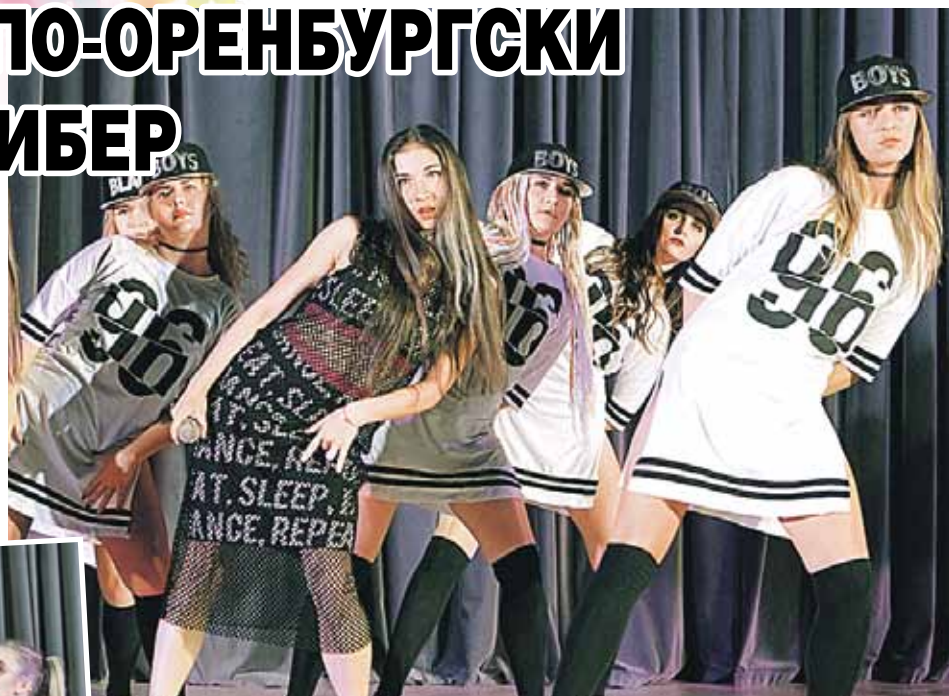
На концертах ростовчан развлекали не только конкурсанты-вокалисты, но и приглашенные артисты, а также ансамбли современных и народных танцев из России и Беларуси.