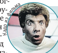
Чудак, «Человек ниоткуда» (1961)

- В Витебске первый раз побывал лет восемь назад, когда спектакля еще не было. Атмосферу этого города постарался передать в постановке. Что бы Шагал ни писал - библейские