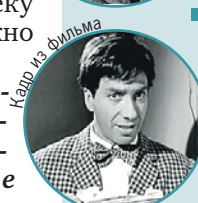
Остап Бендер, «Золотой теленек» (1968)