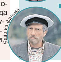
Дядя Митя, «Любовь и голуби» (1984)

- В Театре Моссовета идут два ваших спектакля - «Полонез» и «Предбанник». Оба поставлены в духе комедии абсурда. Чем привлекает этот жанр?