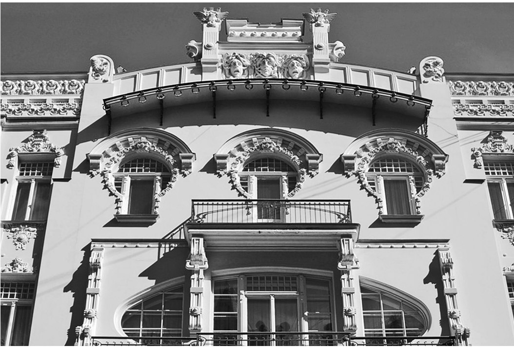
Дом 4 по улице Алберта в Риге

Вначале Эйзенштейн создал в Риге ряд домов в стиле эклектизма. В январе 1898 года в его семье родился сын Сергей, и начиная с 1901 года творческий почерк Эйзенштейна резко меняется. Возведенный в 1901 году жилой дом на улице Элизабетес, 33, можно считать зданием переходного периода в творчестве