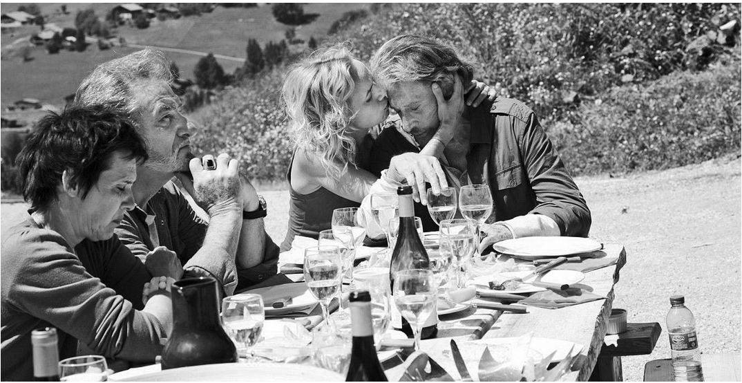
Кадр из фильма Клода Лелуша «Мы тебя любим, мерзавец»

Если говорить о соотношении сильных и посредственных фильмов в конкурсе, то оно такое же, как на крупных международных фестивалях. В фаворе у прессы оказывается тройка-пятерка фильмов, которые в результате и