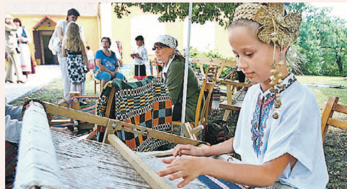
В Гудевичах каждый год проходит фестиваль обрядов и ремесел «Скарбы Гродзеншчыны».