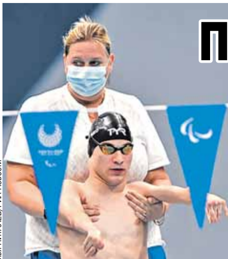
Опускаться в бассейн пловцу из Питера помогала тренер.