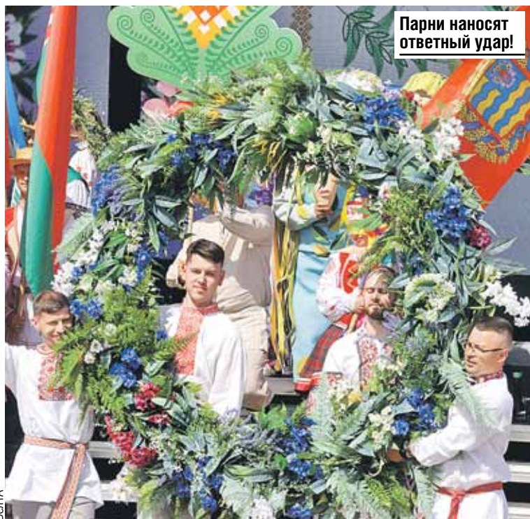
Парни наносят ответный удар!