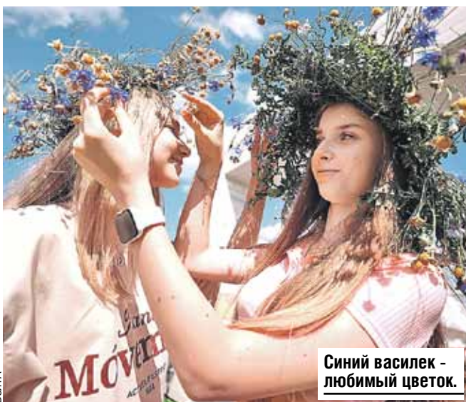
Синий василек - любимый цветок.

Сотни ремесленников от Бреста до Забайкалья представили уникальные изделия ручной работы в самых разных техниках - от соломоплетения до филигрны. Могилевский аэроклуб ДОСААФ подарил гостям красочное авиашоу с го-