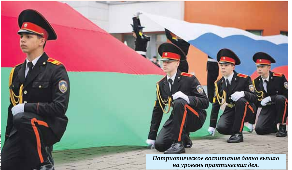
Патриотическое воспитание давно вышло на уровень практических дел.