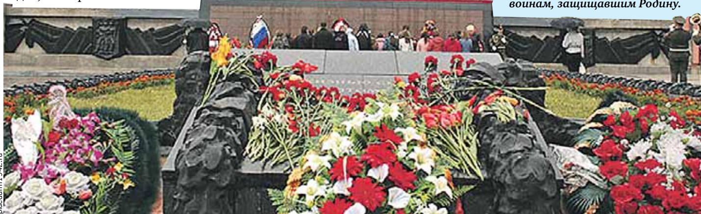
Много солдат похоронено в братских могилах. Каждый такой мемориал - это памятник всем воинам, защищавшим Родину.

- Я стоял на эстраде. Вдруг увидел, как прямо на нас летит