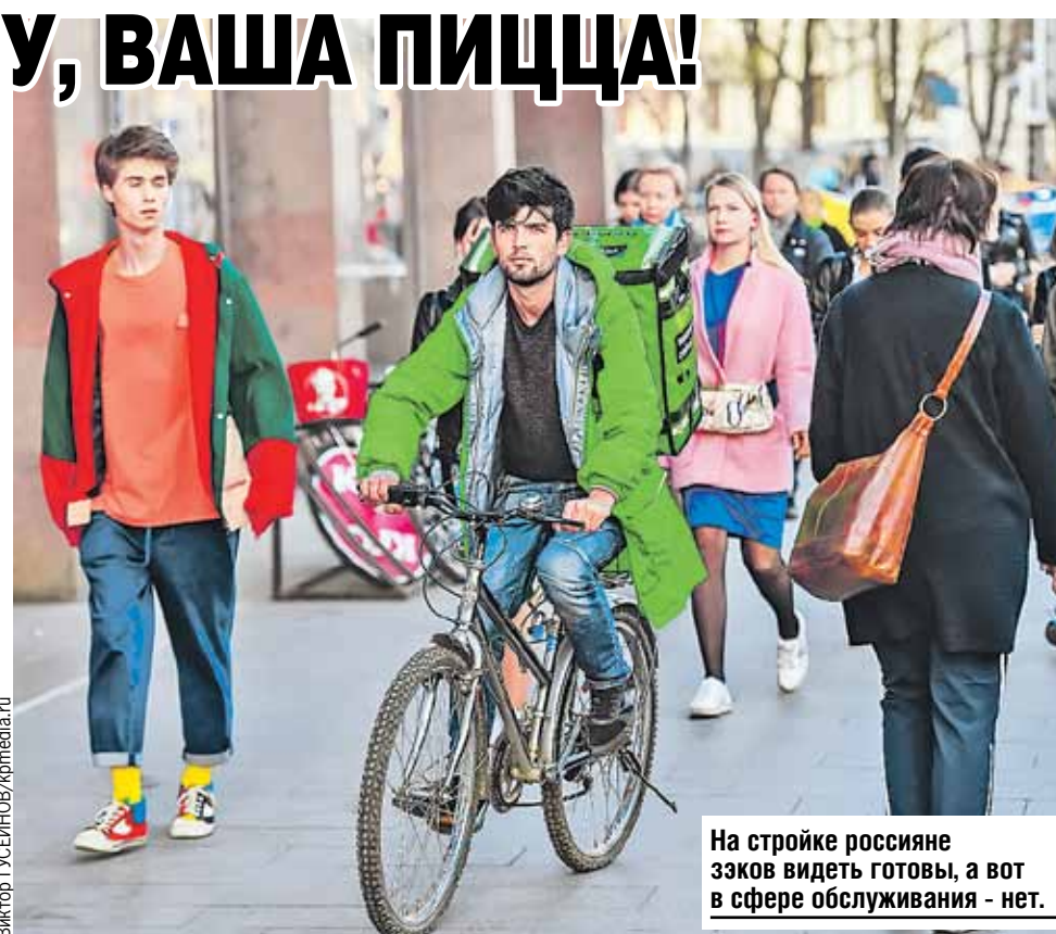
На стройке россияне экзков видеть готовы, а вот в сфере обслуживания - нет.

«нетяжелые» уголовники, конечно же, не смогут. Об этом заявил спикер Госдумы, Председатель Парламентского Собрания Вячеслав Володин :