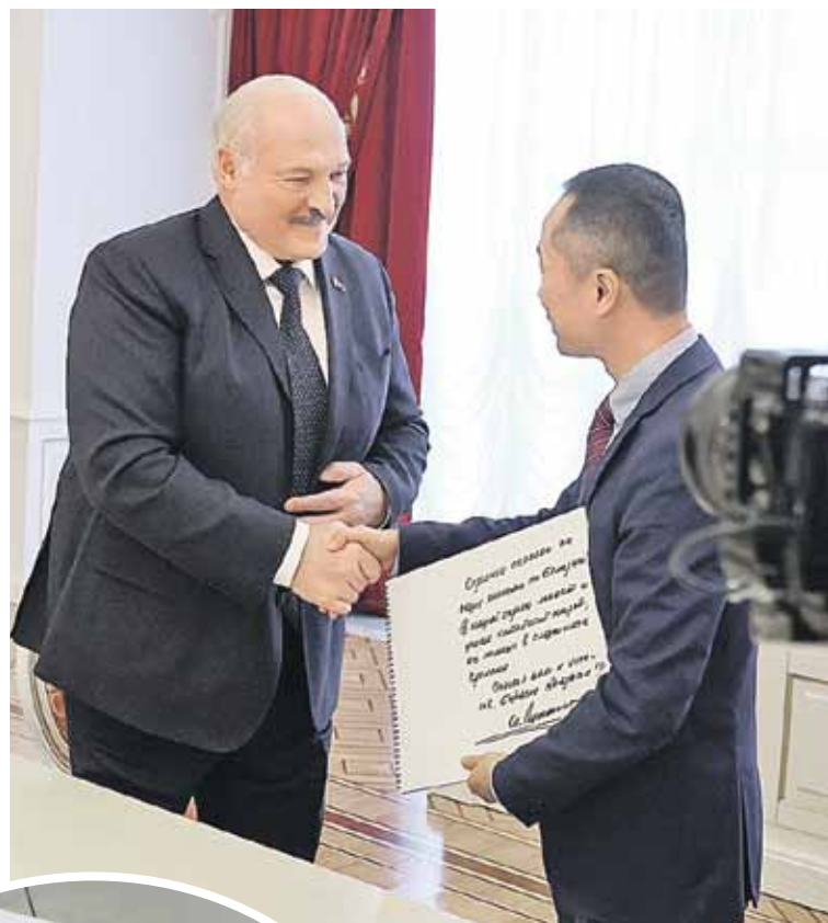
Для информационного агентства «Синьхуа» и Медиакорпорации Китая - пожелания с автографом.

- Некоторые говорят: «Знаете, Россия несколько поторопилась, начав эту военную операцию». А я скажу, что она была неизбежна. Если бы Россия не упредила эту войну со стороны Украины, не упре-