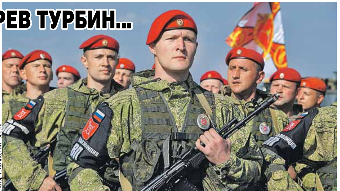
«Хорош в строю - силен в бою», - говорил еще Суворов. Российские бойцы блеснули отменной выправкой на параде открытия учений в «Обуз-Лесновском».

На поле боя тем временем российские десантники и белорусские спецназовцы, перейдя в наступление, доколачивали противника при поддержке танков и ударной авиации. Вражескую систему ПВО ювелирным ударом с воздуха уничтожила четверка тактических бомбардировщиков Су-34 ВКС РФ. В резуль-