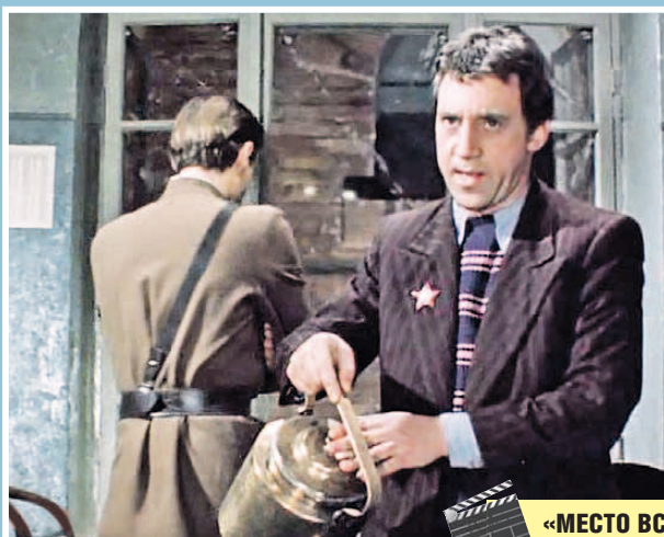
«МЕСТО ВСТРЕЧИ ИЗМЕНИТЬ НЕЛЬЗЯ»

Судя по откликам в соцсетях, такой способ отпраздновать дату понравился всем, а фото вышли достаточно похожими на оригинал. Некоторые омики даже оставили заказы полицейским на следующий год. Они считают, что идею стоит повторить и в следующий раз воссоздать сцены из таких сериалов, как «Глухарь» и «Улицы разбитых фонарей». Видимо, и эти фильмы некоторые уже тоже считают классикой.