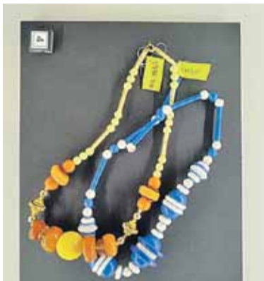
Изготавливая такие бусы, дарила их реквизиторам театра в смутные 90-е годы.

В Театре имени Ленсовета, где актриса служила 22 года, бережно хранятся платья, в которых она выходила на сцену. Не всякая девушка в них влезет, ведь Фрейндлих стройная и миниатюрная. Возможно, это эхо блокадного детства, когда голод косил жителей Ленинграда. Семья Фрейндлих выжила благодаря маме отца - тоже не менее титулованного артиста. Педантичная бабушка делила «125 блокадных