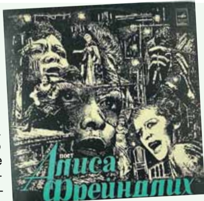
Диск, за которым гонялись поклонники.

Потом я играла Блоху в спектакле «Левша», и она принесла мне из дома металлический поясок, чтобы украсить мой костюм. Вообще она все приносила в театр - аксессуары, красивые полотенца, любые вещи - и несла в реквизиторский цех. В театре всегда что-то нужно, все актрисы несут украшения и потом там оставляют. Я с тех пор тоже так делаю.