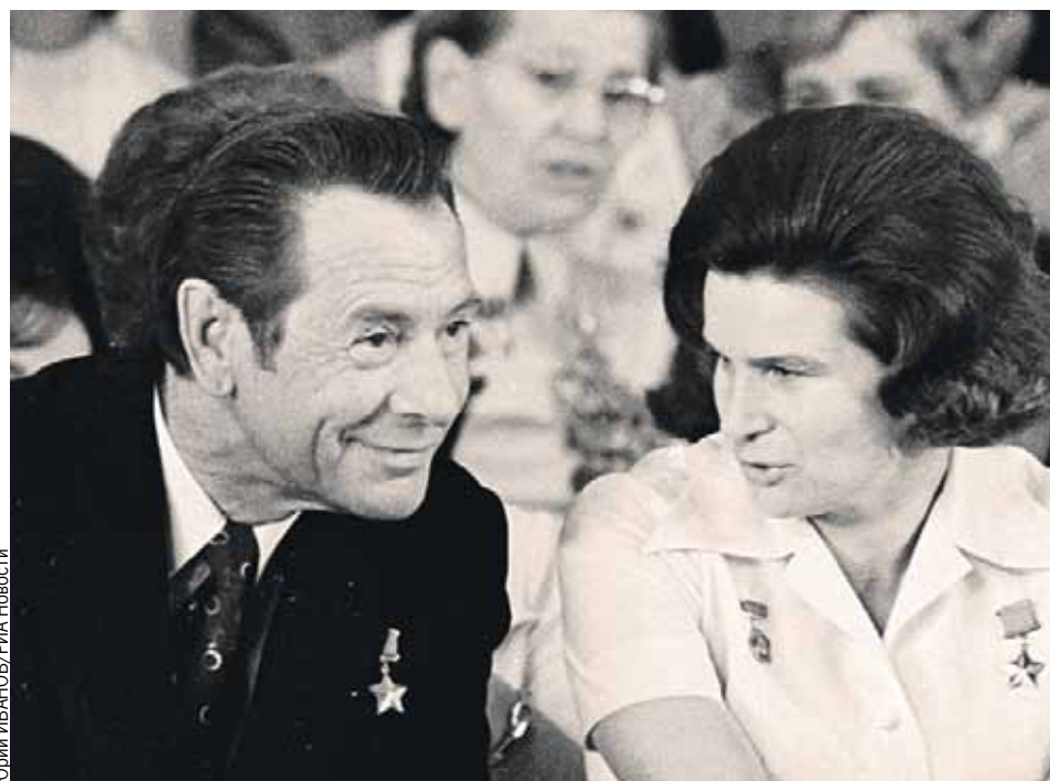
Петр Миронович Машеров с Валентиной Терешковой.

Национальной академии наук Беларуси, Научно-исследовательского Центра фундаментального многотомного труда «Великая Отечественная война 1941 - 1945 годов».