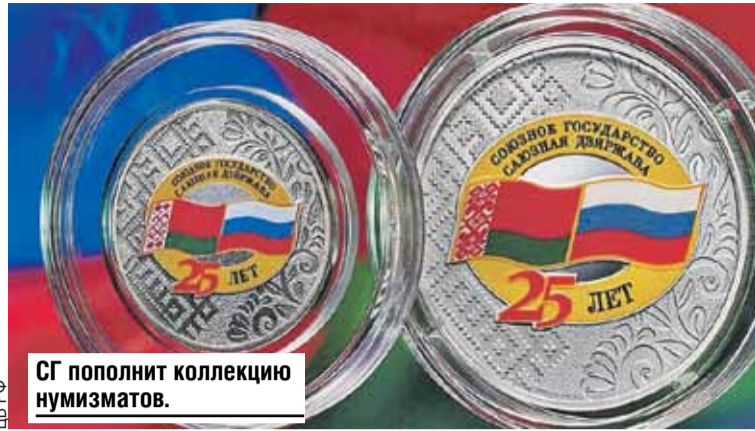
СГ пополнит коллекцию нумизматов.

Кроме того, 8 декабря, в день подписания Союзного договора, в Минск приедет маэстро Валерий Гергиев с одним из своих коллективов. Намечены и гастролы Большого театра Беларуси в Москве.