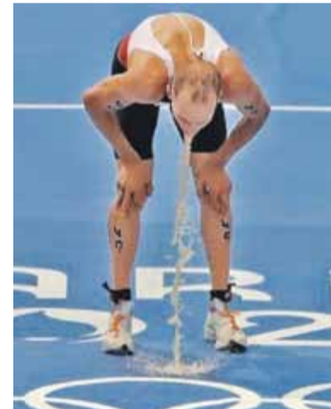
Олимпийский девиз переделаем на «быстрее, дальше, сильнее».

Хорька! Живого. В Ричмонде есть затейливый конкурс «Хорек в штанах». Надо удержать пушистика, который задыхается и пытается выбраться - царапается и кусается. Рекорд - пять с половиной часов мучений животного.