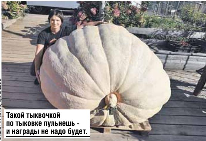
Такой тыквочкой по тыковке пульнешь - и награды не надо будет.

Какие, к черту, олимпийские идеалы и принципы. Бах все это выбросил в помойку. Рас-