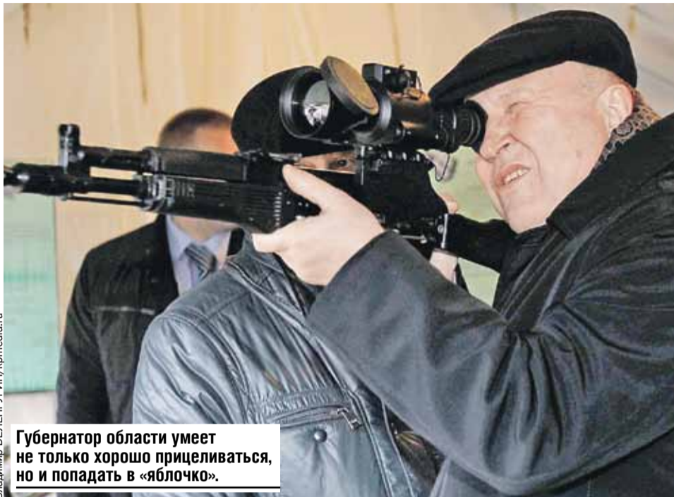
Губернатор области умеет не только хорошо прицеливаться, но и попадать в «яблочко».

Мы намерены и в дальнейшем уделять особое внимание развитию сотрудничества с Беларусью, внедряя новые направления. Есть полная уверенность, что работа в тесном контакте даст хорошие результаты.