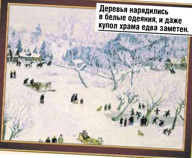
Деревья нарядились в белые одеяния, и даже купол храма едва заметен.

С 1908 по 1958 год у художника был дом в подмосковном Лигачеве. Многие прекрасные картины написаны именно там, как и «Волшебница». Ее он создал в 1912 году - тогда Юон был молодым, полным сил художником, который искал собственные темы и пробовал новое. Шедевр тоже выставлен в Русском музее.