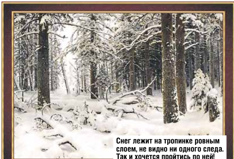
Снег лежит на тропинке ровным слоем, не видно ни одного следа. Так и хочется пройти по ней!