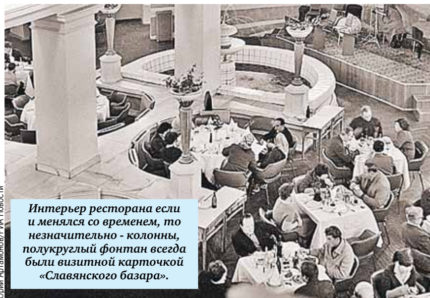
Интерьер ресторана если и менялся со временем, то незначительно - колонны, полукруглый фонтан всегда были визитной карточкой «Славянского базара».

В «Базаре» засиживались, как говорили, «до журавлей». Не в том смысле, что в алкогольном мареве гостям мерещились изящные птицы, а в совсем ином - купцы заказывали хрустальный графин коньяка, расписанный золотыми журавлями, за 50 рублей. Кто оплачивал коньяк, тому и доставался опустошенный графин.