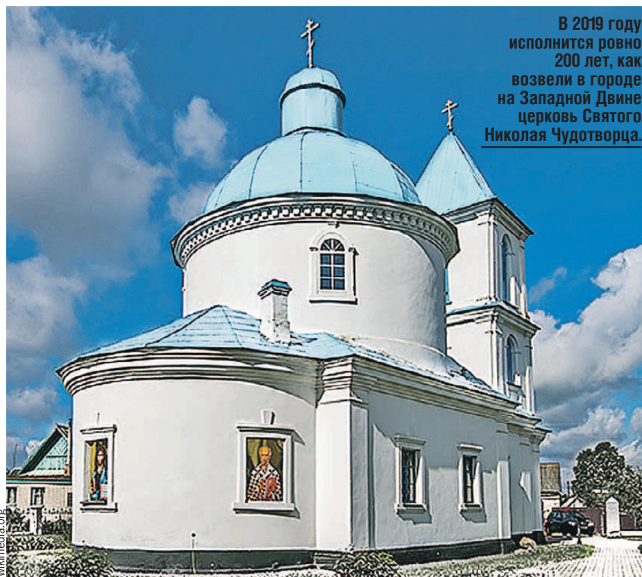
В 2019 году исполнится ровно 200 лет, как возвели в городе на Западной Двине церковь Святого Николая Чудотворца.